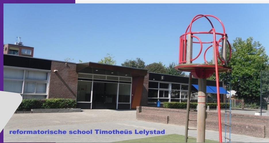
reformatorische school Timotheüs Lelystad

reformatorische school Timotheüs te Lelystad